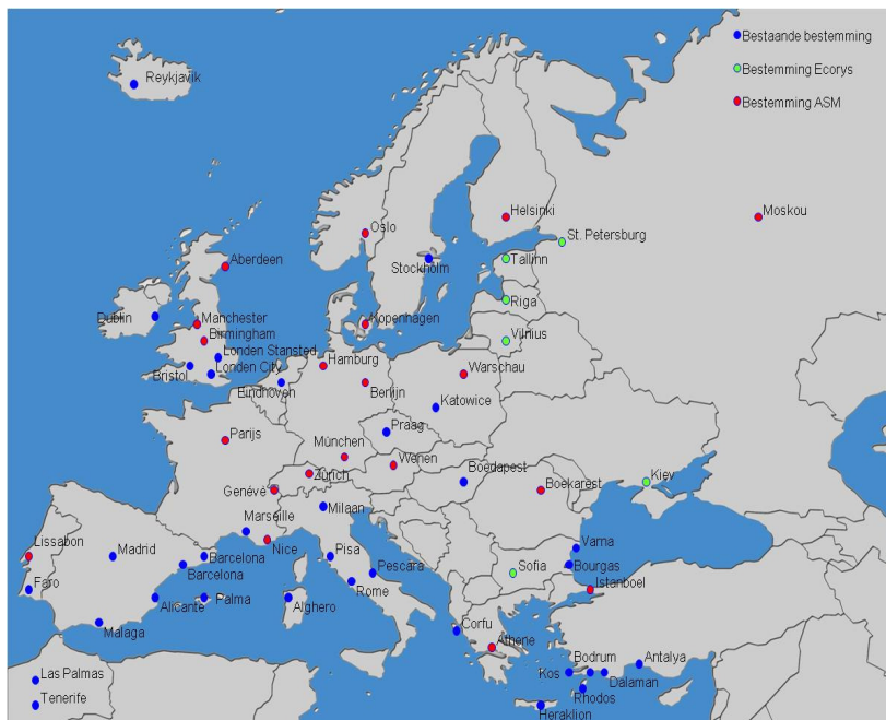
Identificatie 26 potentiële nieuwe bestemmingen door Ecorys en ASM